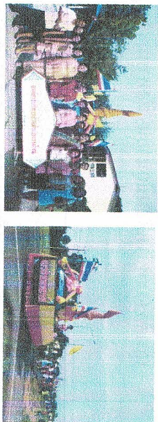
กิจกรรมงานศาสนา