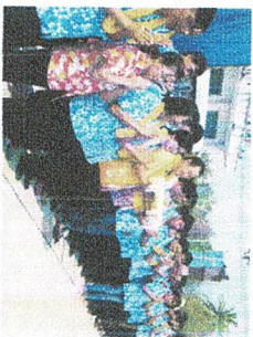
งานวัฒนธรรม และประเพณี