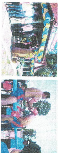
กิจกรรมงานกีฬาและนันทนาการ